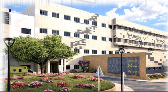
HOPITAL 240 LITS A AIN M'LILA WILAYA D'OUM EL BOUAGHI

Notre bureau d'étude fait partie d'un réseau de 12 bureaux répartis dans tout le pays.