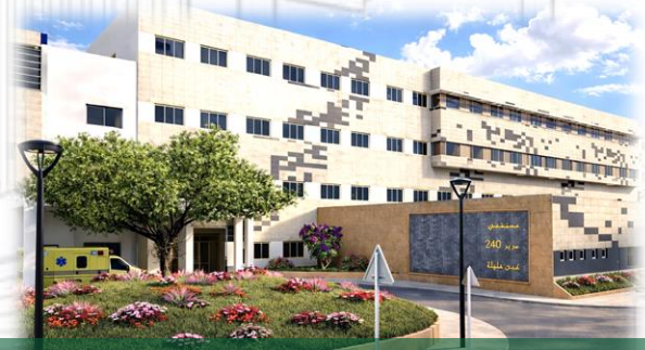
مستشفى 240 سرير عين مليلة ولاية ام البواقي

مكتبنا جزء لا يتجزء من مجمع الدراسات و الهندسة, الذي يشمل 12 مكتب دراسات على مستوى التراب الوطني للتكفل باحتياجات السوق.